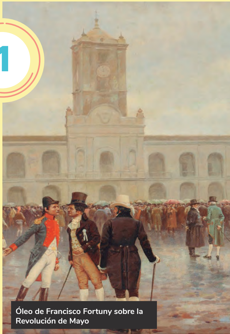
Óleo de Francisco Fortuny sobre la Revolución de Mayo