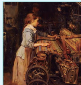
La niña obrera, pintura de Joan Planella y Rodríguez (1889).

Informe del Comité Sadler, Reino Unido, 1831. (Fragmento).