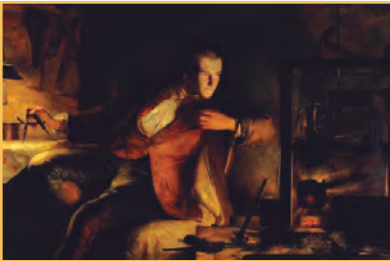
James Watt (1736-1819) fue un ingeniero que perfeccionó la máquina de vapor para su uso industrial. Pintura de Eckford Lauder, 1855.

Si bien no hay una fecha exacta de inicio de estas transformaciones, los primeros cambios comenzaron a hacerse evidentes en el Reino Unido de mediados del siglo XVIII, que para ese entonces era una potencia consolidada. Su población había aumentado notablemente, su economía estaba lo suficientemente sólida, y políticamente, se encontraba estable.