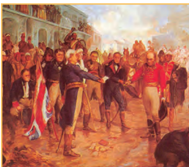
La reconquista de Buenos Aires, pintura de Charles Fouqueray.

Los vecinos de la ciudad de Buenos Aires no estaban dispuestos a aceptar pasivamente la invasión inglesa y organizaron la resistencia. El principal encargado fue Santiago de Liniers, un militar francés al servicio de España, que organizó a la población en milicias, para la defensa de la ciudad. Estas se organizaron en regimientos, en función del origen social y étnico de sus integrantes: así, hubo milicias de negros, de mulatos y de criollos, entre otras.