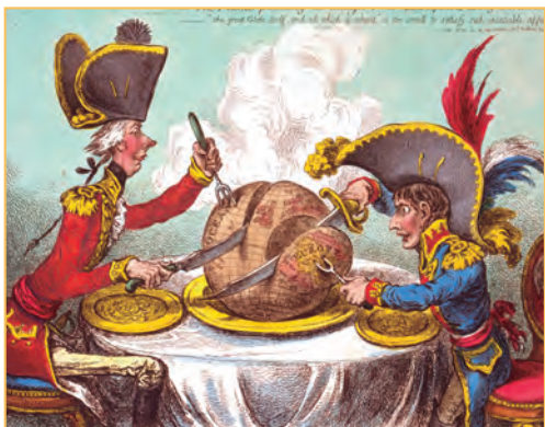
Caricatura de la época que muestra a Napoleón quedándose con parte del planeta.

Pero cuando, en 1810, los ejércitos de Napoleón invadieron toda la península, la Junta se disolvió y el poder entró en crisis. Ante esta situación, y con el rey Fernando preso en Francia, ya no existía un gobierno legítimo en España, es decir, un gobierno que las colonias reconocieran como propio. Ese contexto hizo posible la revolución en Buenos Aires.