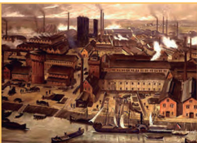
La presencia de las chimeneas de las nuevas fábricas transformó el paisaje de las ciudades y de los pequeños asentamientos. Pintura de Robert Stieler, 1881.