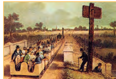
La primera línea de ferrocarril del mundo se inauguró el 15 de abril de 1830, en el Reino Unido y conectó las ciudades de Liverpool y Manchester.

Por otro lado, las medidas tomadas en Francia se imponían en los distintos países que las tropas napoleónicas iban conquistando. De este modo, la Revolución francesa no solo modificó las bases sociales dentro de sus fronteras, sino también en varios países de Europa. A partir de entonces, fue difícil para los monarcas europeos mantener sus privilegios. Los pueblos comenzaron a reclamar reformas y constituciones que limitaran el poder de los reyes, y que ampliaran los derechos civiles, como aquellos que los franceses habían logrado.