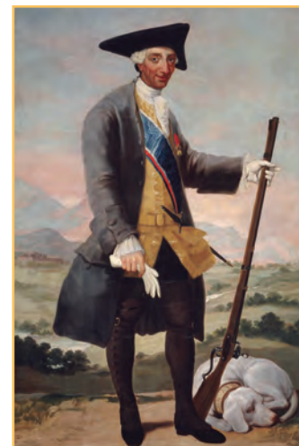
Uno de los principales impulsores de las reformas borbónicas fue Carlos III.

Por último, se permitió la formación de un ejército en América, es decir, la presencia de un grupo permanente de soldados, integrado por criollos y controlado por las autoridades españolas. Esta medida se tomó ante la imposibilidad de enviar tropas suficientes desde la metrópoli para que ejercieran mayores controles.