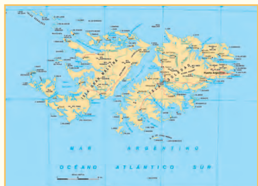
Mapa de las Islas Malvinas