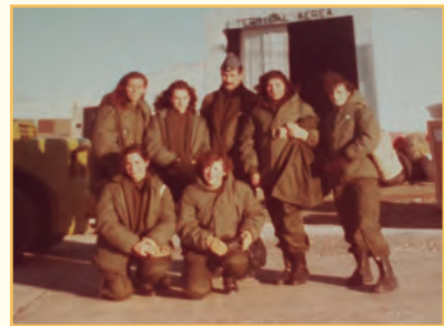
Grupo de mujeres que participaron en el conflicto bélico: sus labores solían estar vinculadas a las tareas médicas.