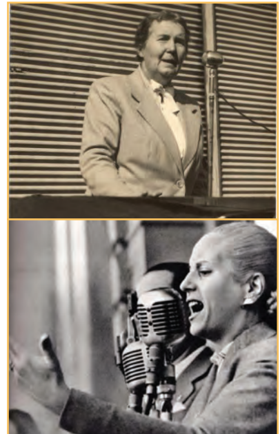
Alicia Moreau de Justo y Eva Duarte de Perón fueron dos mujeres argentinas vinculadas a la actividad política, que bregaron por la obtención del voto femenino y la igualdad en ese derecho con respecto a los hombres.

La democracia argentina fue interrumpida en seis oportunidades por golpes de Estado , en los cuales un grupo militar, civil o cívico-militar ocupaba el poder por la fuerza, violando el principio de soberanía popular e impidiendo el normal desarrollo del sistema democrático.