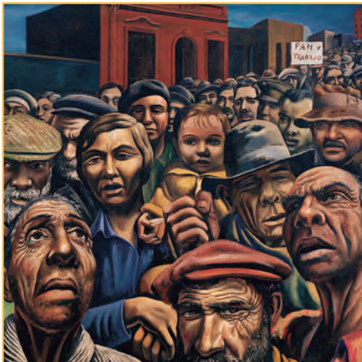
Manifestación , cuadro de Antonio Berni (1934).

La participación en los distintos ámbitos de la vida cotidiana forma parte de nuestra vida como ciudadanos, y el ejercicio de esa participación hace posible el fortalecimiento de nuestra democracia.