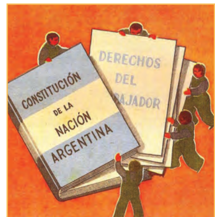
La reforma constitucional de 1949 incorporó los derechos de los sectores más vulnerables, como los niños, los ancianos y las mujeres.

Posteriormente, hubo tres modificaciones más: en 1966, en 1972 y en 1994. Esta última reforma incorporó nuevos derechos, como el derecho al medioambiente, el derecho de los consumidores y el derecho a la información, entre otros; y se modificaron algunas características de los cargos, por ejemplo, se estableció la posibilidad de la reelección del Presidente.