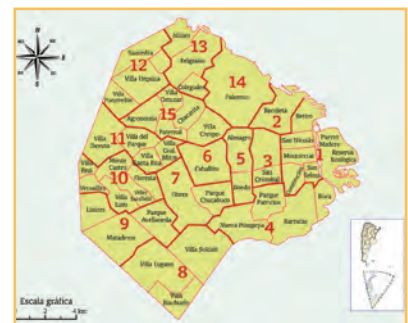
Comunas de la Ciudad Autónoma de Buenos Aires

Entre sus competencias, las comunas pueden planificar, ejecutar y controlar los trabajos de mantenimiento urbano de las vías secundarias y otras de menor jerarquía: el arreglo de veredas, baches, arbolado y luminarias, además del cuidado de plazas y edificios públicos. De las avenidas de la Ciudad, se encarga la Administración Central. Siete vecinos serán los integrantes de cada una de las juntas comunales, que tendrán un mandato de cuatro años, con la posibilidad de ser reelectos nuevamente, con cuatro años de intervalo.