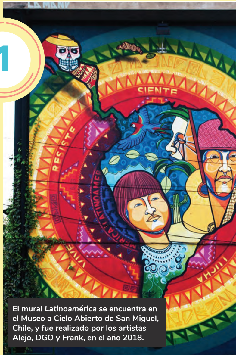
El mural Latinoamérica se encuentra en el Museo a Cielo Abierto de San Miguel, Chile, y fue realizado por los artistas Alejo, DGO y Frank, en el año 2018.